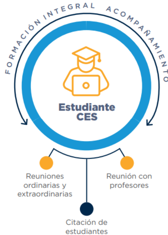
Figura 5. Comité de Promociones

tiene como objetivo orientar al estudiante, basándose en la información obtenida en el proceso de acompañamiento que realizan los docentes y coordinadores académicos. Las decisiones del Comité de Promociones favorecen la formación integral del estudiante, de acuerdo con sus necesidades particulares, su realidad social y su proceso de adaptación y evolución dentro de la vida universitaria. Este comité, busca intervenir dificultades puntuales de los estudiantes, generar alertas en los procesos de desarrollo, adaptaciones curriculares necesarias, entre otros muchos procesos complejos en los que el estudiante sigue siendo el centro del proceso.