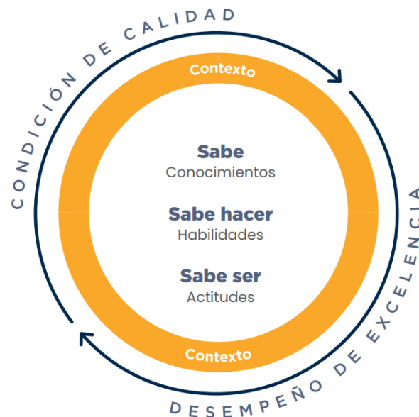
Figura 1. Las competencias en la Universidad CES

El Proyecto Educativo Institucional define dos tipos de competencias: las fundamentales y las profesionales. Las competencias fundamentales tienen un carácter transversal, se encuentran presentes en todos los programas de la universidad y están inspiradas en los valores institucionales (competencia comunicativa, competencia ciudadana y competencia de desarrollo personal).