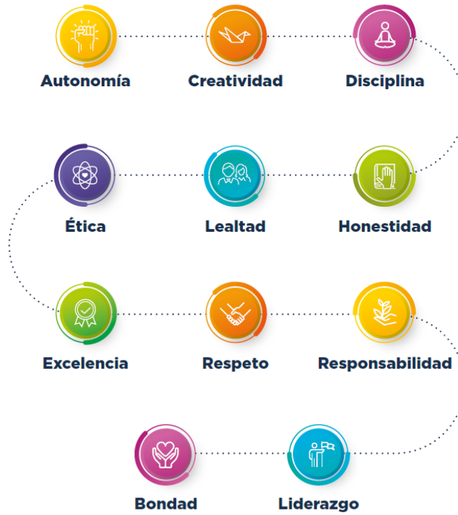
Figura 1. Valores de la Universidad CES