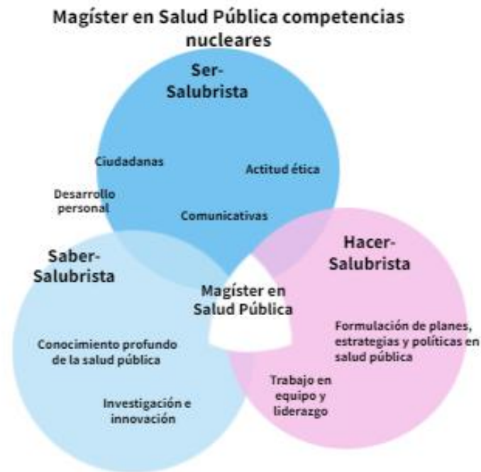
Figura 2. Competencias del egresado de la Maestría en Salud Pública